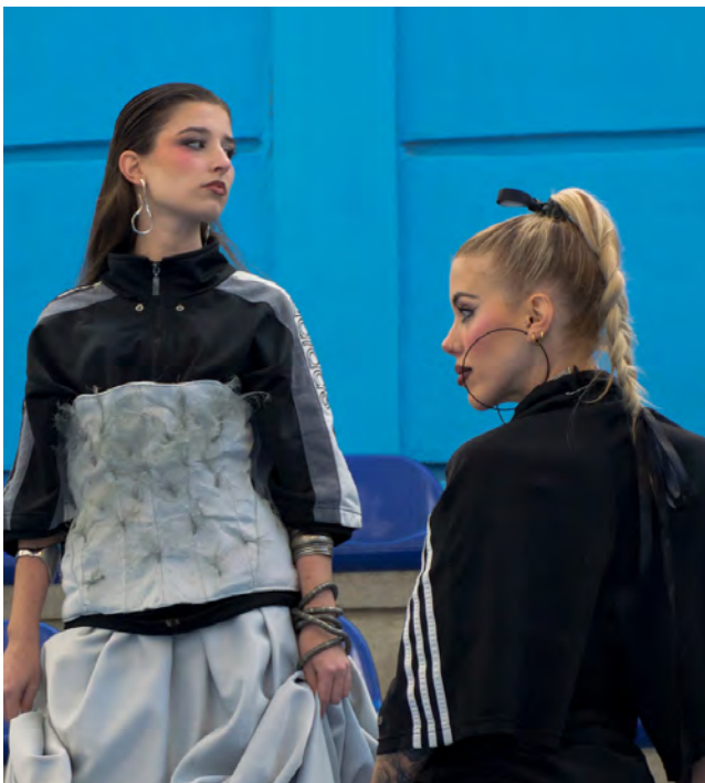
Proyecto colectivo diseño de moda y diseño gráfico

Conocerás el funcionamiento real del sector de la moda, explorarás distintos ámbitos profesionales y facilitarás tu acceso al mercado laboral.